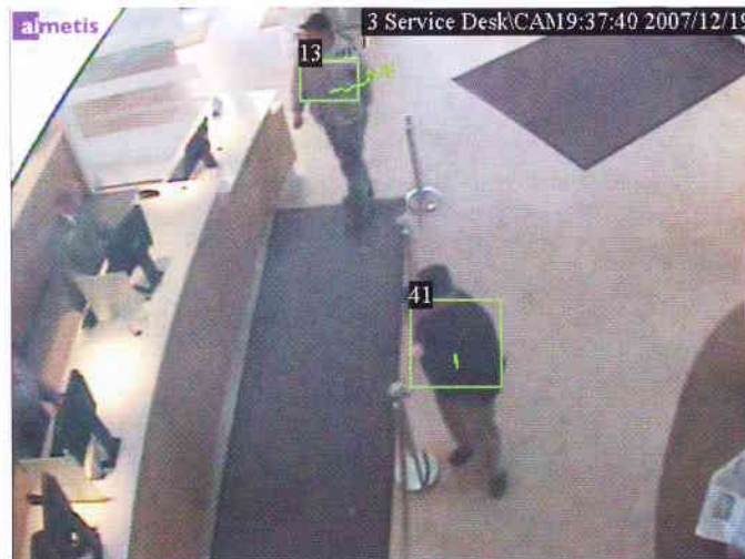
Objekte in einer zu überwachenden Szene werden verfolgt und klassifiziert, rechts die Erkennung von Objekten